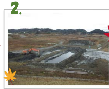
▲ 地盤改良工 排泥処理