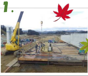
▲ 地盤改良工 施工状況