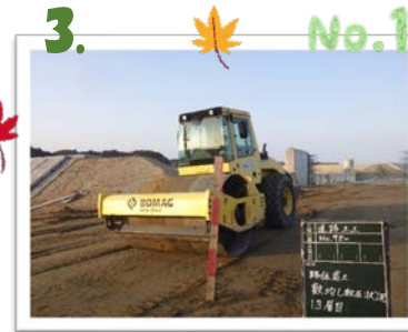
▲ 道路土工 路体盛土