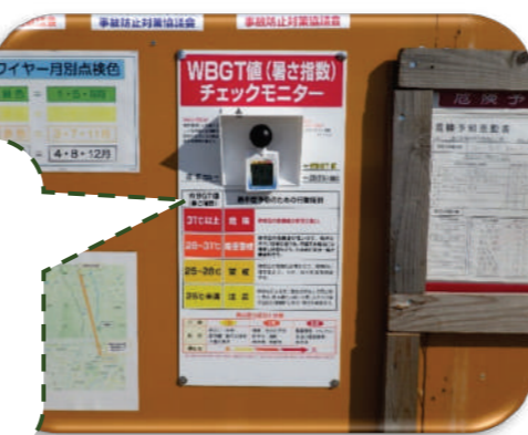
▲ 現場掲示板にWBGT値チェックモニター（暑さ指数）の設置