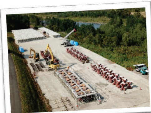
▲ 1区画20個のブロックが4区画あり、1日1区画分のブロックを製作します。