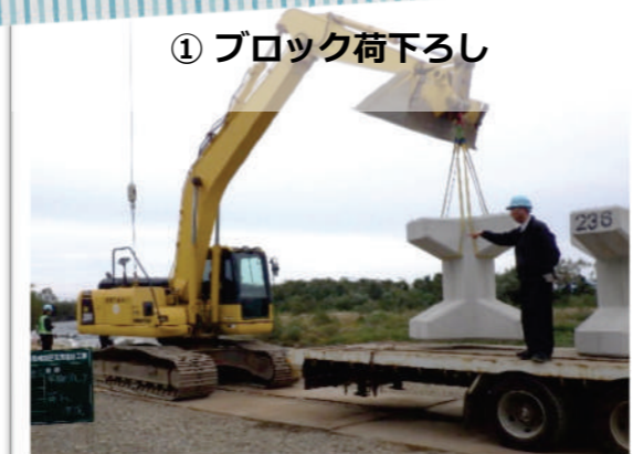
▲ 完成したブロックを河岸に運びます。1度に3個運ぶことができます。