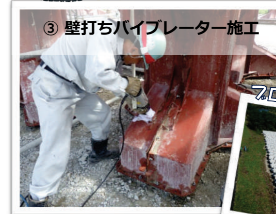
▲ ブロックに気泡が残らないよう、壁打ちパイブレーターを併用しました。