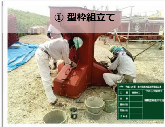
▲ ブロックの型枠を組み立てます。