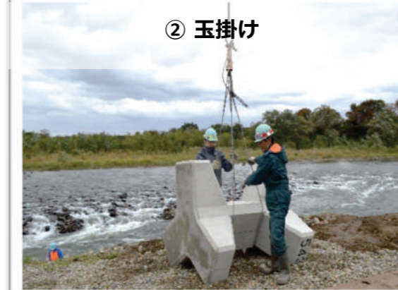
▲ 下ろしたブロックにフックをかけ、据付作業に移行します。