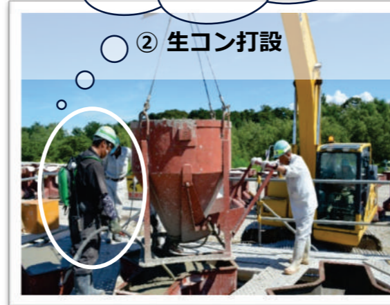
▲ 組立てた型枠を使い、生コンを打設します。