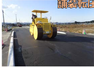
12.アスファルト 舗装転圧