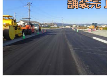
13.アスファルト 舗装完了