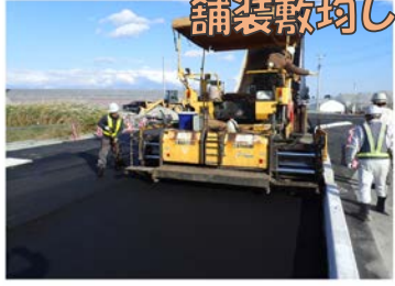
11.アスファルト 舗装敷均し