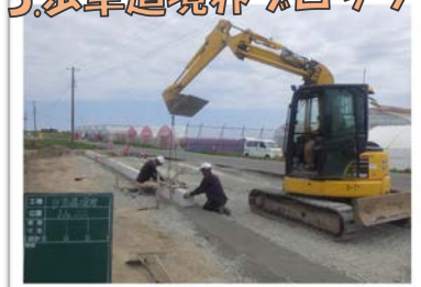
5.歩車道境界ブロック No.2